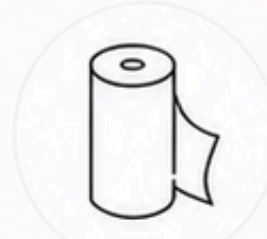
キッチンペーパー