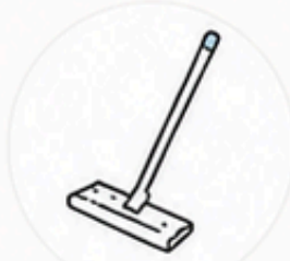
フローリング ワイパー