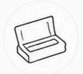
トイレ用 ウェットシート